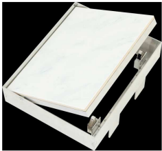
01/Z (POHLED Z INTERIERU)